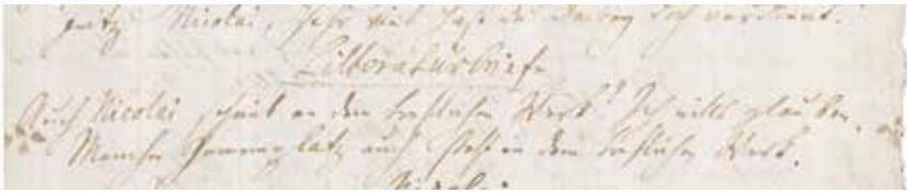
Friedrich von Schiller, Xenion „Litteraturbriefe“ Goethe- und Schiller-Archiv 25/W 684