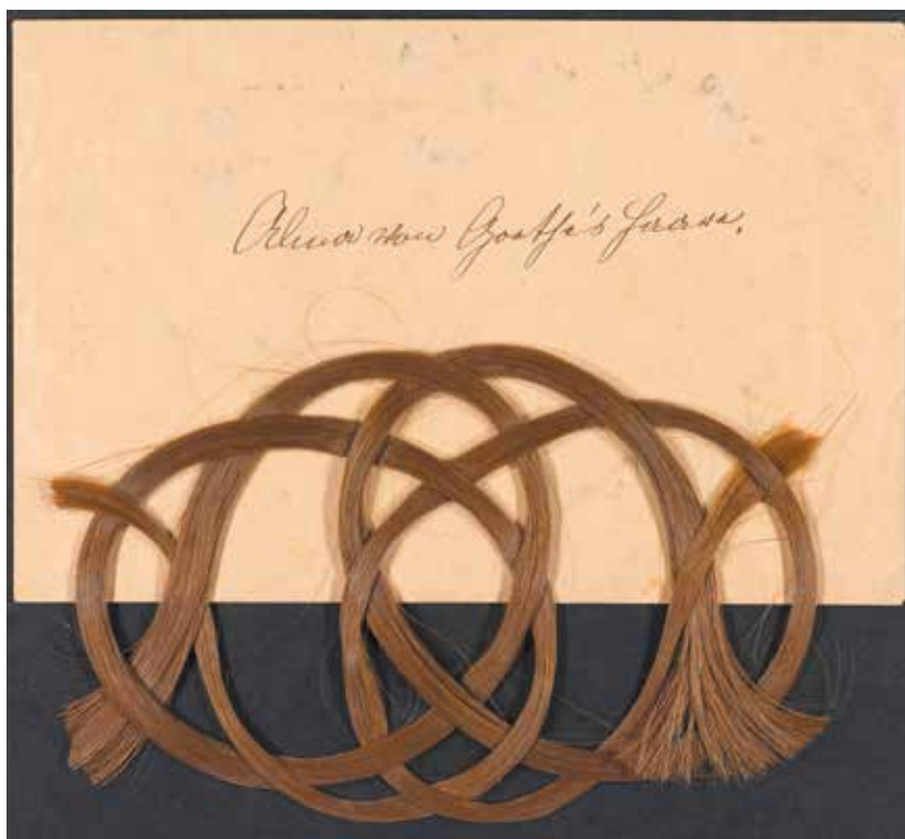
Haare Alma von Goethes Goethe- und Schiller-Archiv 114/309

genstände u.a. in einer nach „Provenienzen“ geordneten Übersicht erfasst und dem im Archiv schon existierenden Familienbestand Vulpus (114) angegliedert (Sign. 292–355).