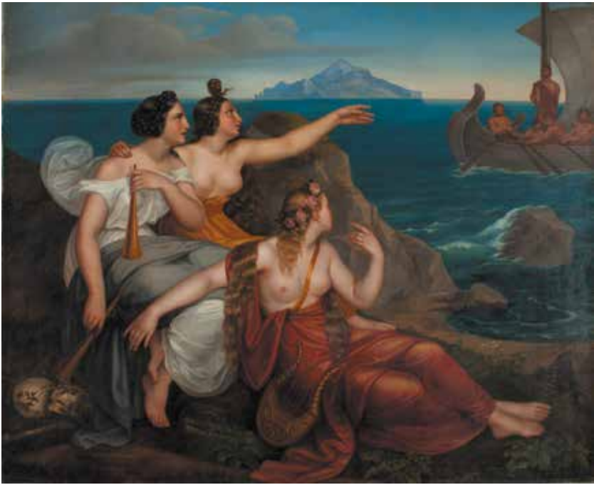
Abb. 8. Louise Seidler, Die Sirenen-Insel. Szene aus der Odyssee

lichen zwei geflügelten Vogelfrauen eine dritte Sirene zur Seite gestellt, es sind Frauen mit Doppelflöte, Panflöte und Kithara. Antike Darstellungen der Sirenen auf Vasen, Sarkophagen oder im Fresko hatte Louise Seidler nicht nur aus der Literatur entnehmen, sondern auch während ihres fünfjährigen Studienaufenthaltes in Florenz, Rom und Neapel im Original sehen können.