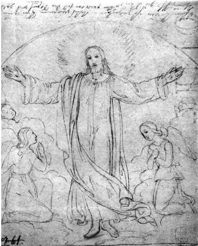
Abb. 3. Louise Seidler, Christus, der Erbarmer

Klärung bietet sich eine kleine Zeichnung aus dem Nachlass des Malers und Direktors des Städelschen Kunstinstituts in Frankfurt am Main, Philipp Veit (1793–1877) an, Louise Seidlers wichtigsten Künstlerfreundes und Beraters. 6