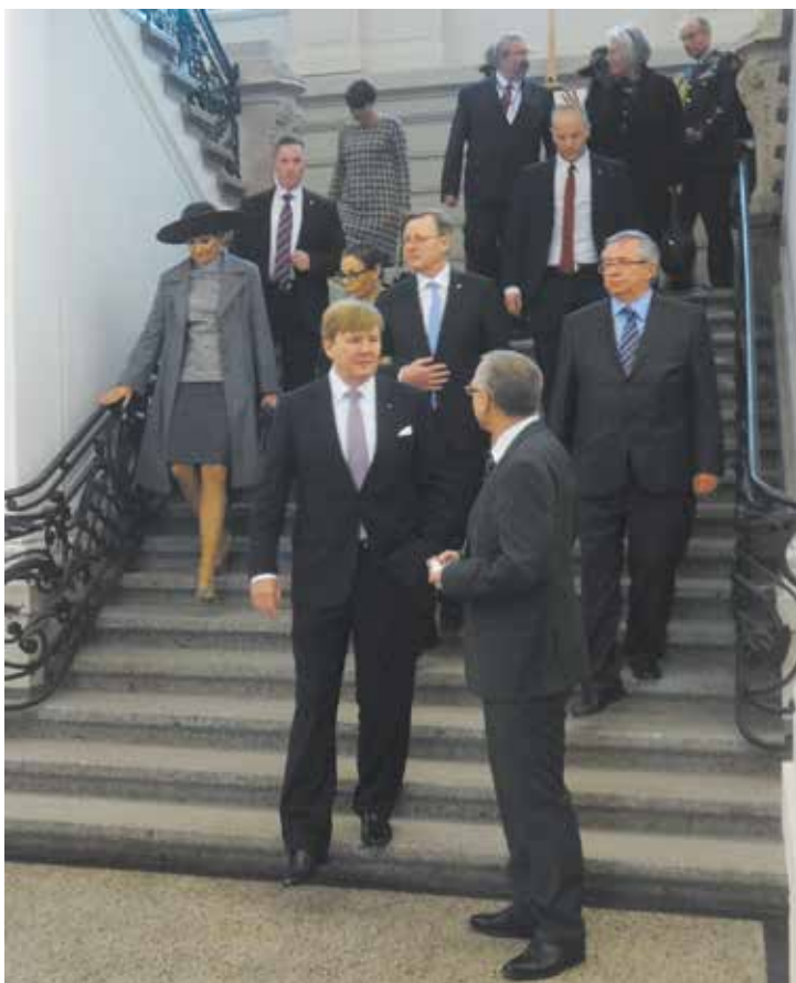
Besuch des niederländischen Königspaares Willem-Alexander und Máxima im Goethe- und Schiller-Archiv am 8. Februar 2017