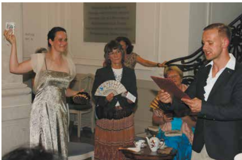
Aufführung von Charlotte von Steins „Rino“ durch Mitarbeiterinnen und Mitarbeiter des Archivs zum Sommerfest am 7. Juli 2017

Anklang. Erfolgreich beendet wurde die gemeinsam von den Freundeskreisen der Klassik Stiftung veranstaltete Vortragsreihe „Bestandsgeschichten“, in deren Folge im Berichtszeitraum die Nachlässe von Georg Büchner, Franz Liszt, der Familie Stein-Schardt und Friedrich Wilhelm Riemers im Archiv vorgestellt wurden. Einen Höhepunkt bildet die Präsentation der neu ins Archiv gekommenen Handschriften jeweils zum Jahresende. Auch die geselligen Veranstaltungen erfreuen sich großer Beliebtheit, wie die jährliche Exkursion im Frühjahr – 2016 nach Rudolstadt und Kochberg sowie 2017 nach Dornburg und Tautenburg. Neben treuen Besuchern erweitert bzw. verändert sich der Kreis je nach Interessenlage. Nun schon zu einer guten Gewohnheit sind die Sommerfeste im Archiv geworden, die von der Freundesgesellschaft und den Mitarbeiterinnen und Mitarbeitern des Archivs gemeinsam gestaltet werden. Dem kleinen kulturellen Beitrag folgt ein frohes Beisammensein bei Speis und Trank im Freundes- und Kollegenkreis sowie mit der ganzen Familie. Die Entscheidung, die Mitgliederversammlung und das Sommerfest am gleichen Tag zu veranstalten, hat sich, besonders auch für unsere auswärtigen Mitglieder, bewährt. Da das komplette Veranstaltungsprogramm nach wie vor am Beginn des Jahres vorliegt, ist eine langfristige Orientierung nicht nur für unsere Mitglieder möglich.