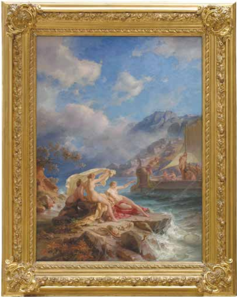
Abb. 9. Friedrich Preller d.Ä., Odysseus und die Sirenen Klassik Stiftung Weimar, Museen

und die Sirenen“. (Abb. 9) Preller hält sich enger an den Text Homers. Das Schiff des Odysseus passiert eine gefährliche Stelle zwischen zwei steinigen Ufern, im Vordergrund winken drei schöne nackte Frauen mit der Hand bzw. wehendem Schleier den Männern im Boot zu. Am Mast windet sich Odysseus vor Verlangen, dem Ruf der Sirenen zu folgen. Das Schiff erscheint im Verhältnis zu den Sirenen groß und mächtig, der hohe Bug ist als Delphin ge-