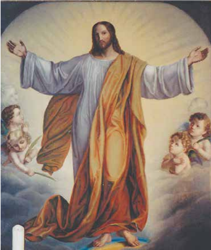
Abb. 4. Louise Seidler, Christus, der Erbarmer Kirche St. Peter und Paul Sehestedt/Schleswig-Holstein

Kunst beseelen, die wie eine heilige Flamme im Innersten Ihres Herzens lodert. [...] Ich umarme Sie mit treuer Liebe, und bin für immer ihre treue Charlotte A. 9