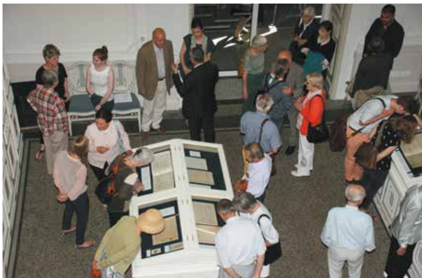
Ausstellungseröffnung »Génie oblige« – Liszt-Autographen aus dem Nachlass am 1. Juni 2017