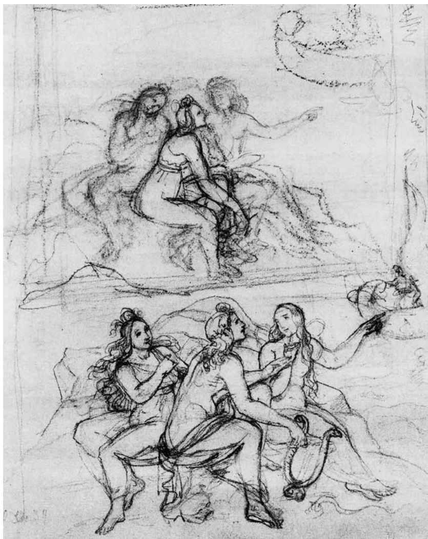
Abb. 7. Louise Seidler, Frauengruppen im Freien, auf ein Schiffweisend Goethe- und Schiller-Archiv 96/2704a Bl. 31