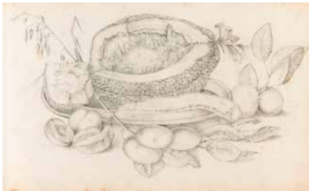
Aus dem Skizzenbuch von Franz von Dingelstedt Goethe- und Schiller-Archiv 157/21a