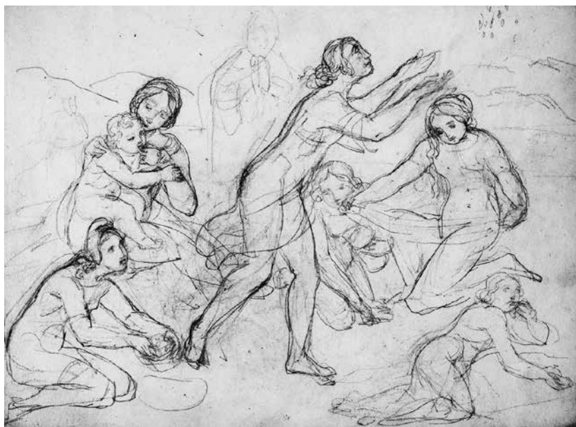
Abb. 1. Louise Seidler, Mannalese Goethe- und Schiller-Archiv 96/2704a Bl. 1

kniend oder sitzend sich mit etwas Essbarem beschäftigen. Das Thema dieser Komposition war dem christlichen Betrachter Anfang des 19. Jahrhunderts geläufig, es ist die Mannalese aus dem 2. Buch Mose des Alten Testaments. Die von ihren Führern Moses und Aaron nach dem Auszug aus Ägypten jahrelang durch die Wüste geführten Israeliten hungerten und dürsteten, so dass Moses Gott um Hilfe bat, die in Form eines Wachtelschwarms und des Manna-Regens auch erteilt wurde. Diese Speise, weiß wie Koriandersamen, fiel nachts auf den Wüstenboden und konnte aufgesammelt werden. Die schon im Altertum tradierte Sage von der wunderbaren Lebensrettung durch Gottes Hilfe war auch Jesus und seinen Jüngern bekannt, denn im Neuen Testament bezeichnete sich Jesus unter Hinweis auf Manna als Brot des Lebens . Im Christentum steht daher Manna als Symbol für die Eucharistie (Abendmahl, N.T. Johannes 6, 30-35). Die Mannalese wurde in der Bildenden Kunst seit dem Mittelalter als Gleichnis für den festen Glauben an Gottes Hilfe benutzt.