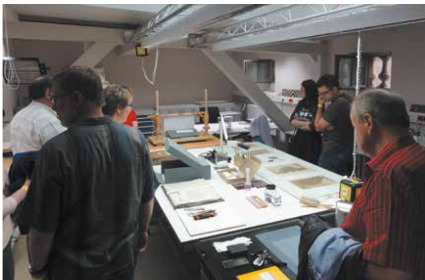
Besucher in der Restaurierungswerkstatt zur Museumsnacht am 11. Juni 2016