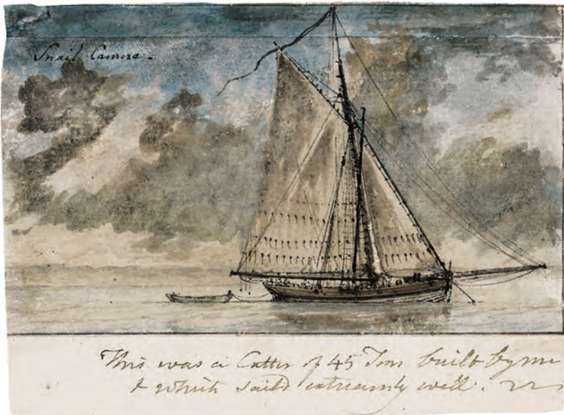
Tafel 14 Charles Gore, Snail Cutter, Aquarell, Feder in Schwarz, Weißhöhung, undatiert