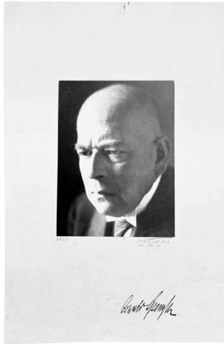
Abb. 1 Oswald Spengler, 1926

Pressemitteilung des Archivs von 1919 spricht, verträgt sich durchaus gut mit Spenglers Untergang . Politisch einte Elisabeth Förster-Nietzsche und Oswald Spengler nicht nur der Nationalismus und die Bewunderung für Benito Mussolini, sondern auch der Wille zu einer notfalls militärisch durchzusetzenden Revision des Versailler Vertrags, der von Deutschland im Juni 1919 unterzeich-