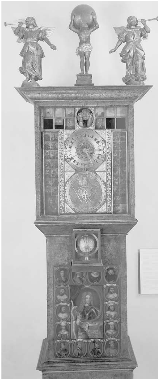
Abbildung 2 Johann Asmann, Lebensuhr des Herzogs Wilhelm Ernst von Weimar, Standuhr mit Glockenspielwerk, 1706